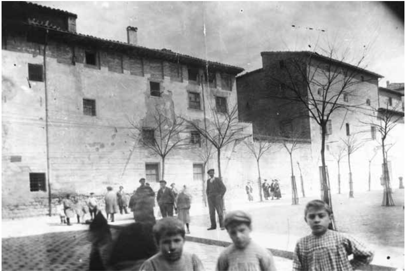
Niños y adultos en la plaza de San Francisco junto a la antigua cárcel (parte trasera del edificio). De autoría desconocida, fue tomada en 1909 (sig. AMP_U0290009).

aquella época como «habitación del Regente». Adosadas a este edificio se encontraban las cárceles reales, con celdas comunales y separadas por sexos.