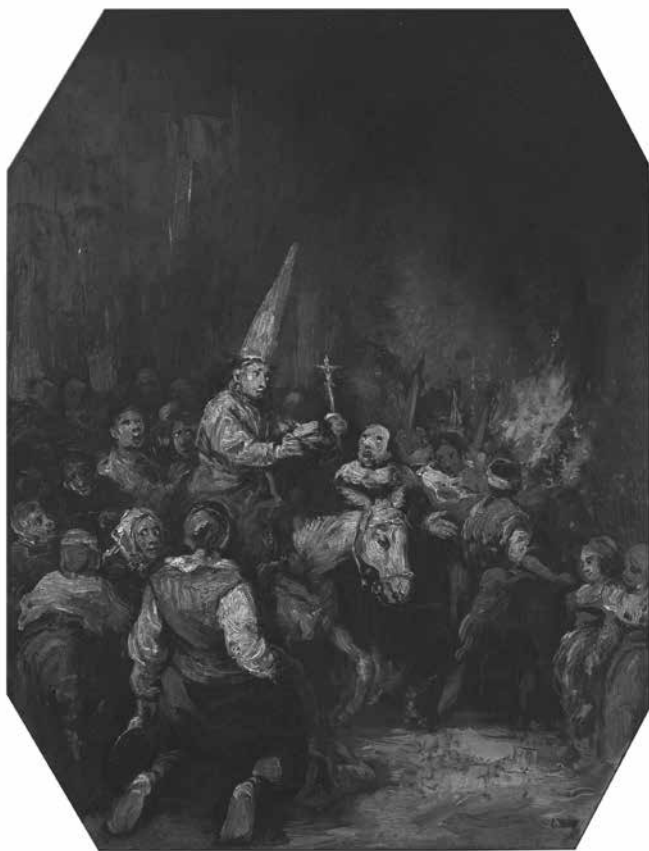
Condenado por la Inquisición , realizado por Eugenio Lucas hacia 1860. Óleo sobre lienzo conservado en el Museo del Prado (Madrid).

comunicar un significado profundo y para convertirse en un acto de talante completamente adoctrinante.