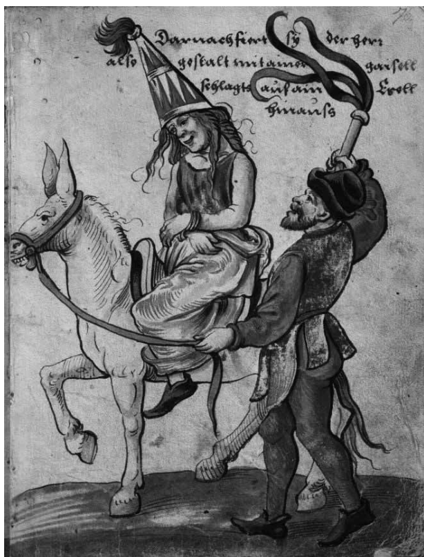
Una mujer siendo azotada en Estella en el siglo XVI, dibujo realizado durante el acto por Christoph Weiditz a su paso por Navarra en 1529. Forma parte de su «Trachtenbuch», conservado en el Museo Nacional Germano.