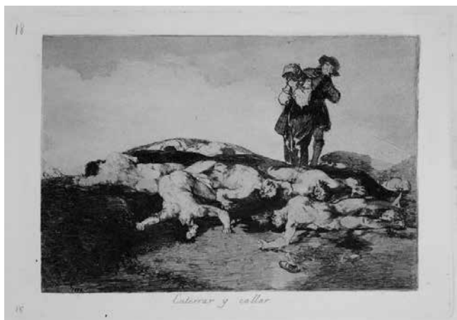
Enterrar y callar , grabado realizado por Francisco de Goya y Lucientes hacia 1810-1812. Pertenece a la serie Desastres de la guerra, nº 18/82.