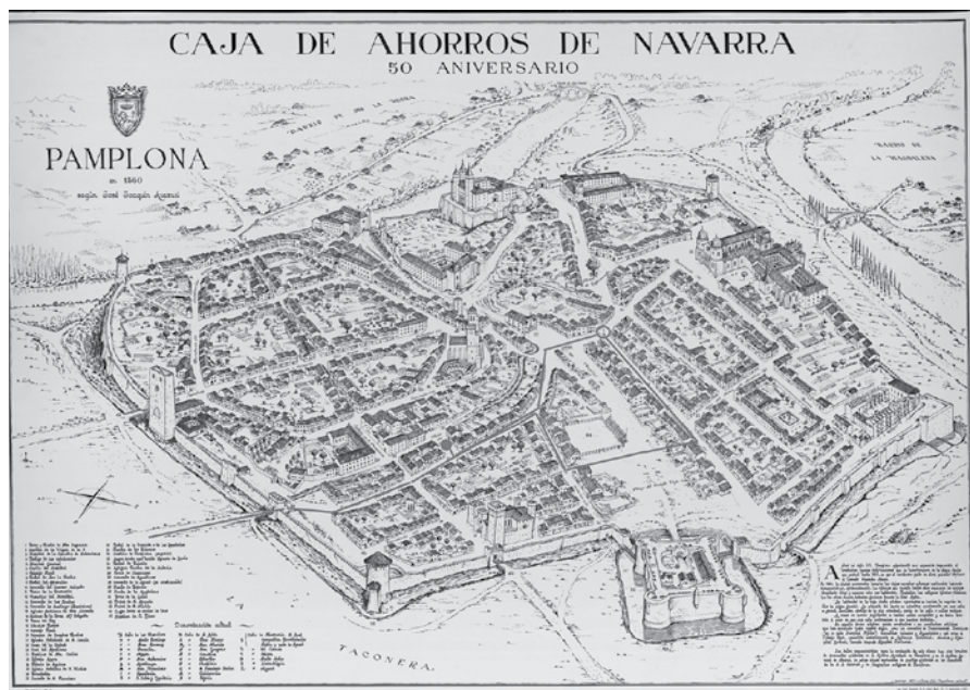
Trazado de las calles que recorrían en la Procesión Infamante, dentro del mapa que ilustra la Pamplona de 1560 según J. J. Arazuri.

todo el recorrido, un coro de niños cantores, miembros de la Cofradía de la Vera Cruz, algunos de los cuales se dedicaban a recoger limosna durante el recorrido, un predicador y una escolta de soldados. En los casos de ahorcamientos solían acudir también el cabildo de San Lorenzo, y en el caso de los agarrados, el de San Cernin.