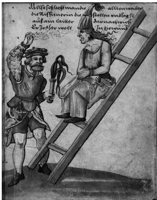
Castigo de una mujer en el siglo XVI, dibujo realizado por Christoph Weiditz durante su viaje a la península en 1529. Forma parte de su «Trachtenbuch», conservado en el Museo Nacional Germano.

dura y complicada. La acusada quedaba marcada de por vida y, muchas veces, también lo era su familia durante generaciones, prohibiéndoseles ocupar puestos de trabajo público. Este factor lo podríamos relacionar con una especie de limpieza de linaje: solo las personas consideradas «puras» serían estimadas y valoradas dentro de la sociedad para ocupar puestos de trabajo público.