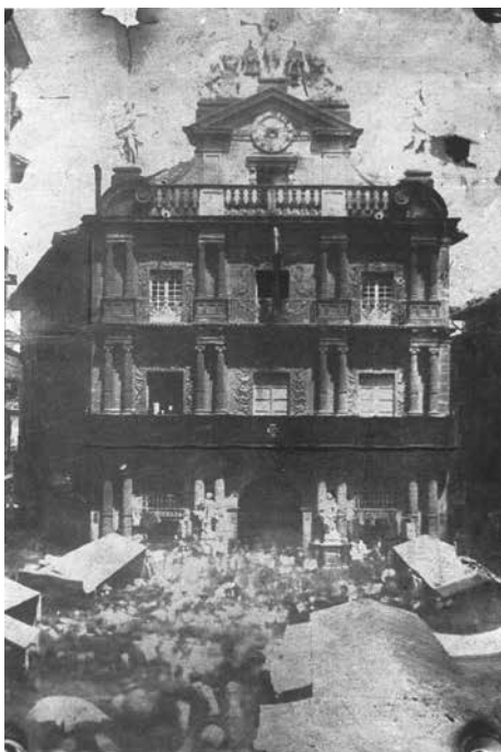
Vista de la Plaza de la Fruta con los tenderetes de venta. Autoría desconocida anterior a 1864 (año en que se suprimió el mercado en esta plaza) (AMP_U0010001).

ella también tuvo « ciertas palabras con M a de Ollo [...] sobre cierto abadejo q la dio », 302 y desde aquel instante empezó a encontrarse muy mal « de manera q no podía valerse de todo su cuerpo ni menos podía andar aviendole privado de poder comer y veber, de manera q parecía q las mejillas de los carrillos y las ternillas de las narices se las en-