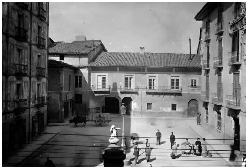
Antigua audiencia territorial y cárcel en la plaza del Consejo (Aquilino García Deán, La Avalancha , 8 de enero de 1910). Original conservado en el Archivo Municipal de Pamplona (sig. AMP001777).

pasó a ser la sede de la Cruz Roja y del Orfeón, hasta 1909, año en el que fue derribado. 120