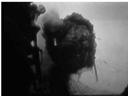
Hormetan zehar aurrera eginez (Israelgo Armadaren bideo-irudia, 2002)

tzaren teoriaren arabera, operazio militar bat unitate txikien zenbait multzo lausok eratutako sare bat da; unitate horiek independenteak dira hein batean, baina elkarren artean koordinatuta daude, eta gainerako guztiarekin elkarlanean jarduten dute.