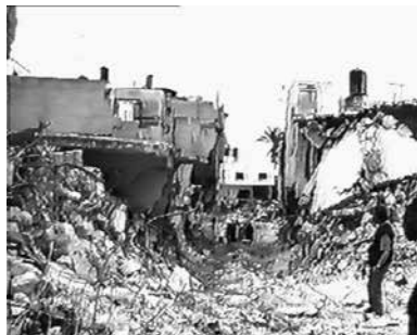
Jeningo iheslari-esparruan zehar zulatutako bide berriak (Palestinako herritarrek egindako bideo batetik ateratako irudiak; 2002ko apirila)

aurkako erasoia Nablusen kontrakoarekin batera hasi zen, 2002ko apirilaren 3an, eta soldadu israeldarrek antzeko metodoak erabili zituzten bietan. Bulldozer militarrek esparruaren ertzetaraino gerturatu ziren, eta zuloak egin zituzten periferiako etxebizitzetako kanpo-hormetan. Gero, ibilgailu blindatuak barnerratu ziren atzera-martxan etxe horietan, eta, hormetan irekitako zuloetan zehar, soldaduak palestinarren etxeetan sartu ziren zuzenean, frankotiratzailleak saihestuz. Handik, soldaduak etxez etxe aurrera egiten saiatu ziren, mehelinetan zehar. Borroka etxeetan eta etheen artean gertatzen ziren bitartean, borrokalari palestinarrak, behe-solairuetako tuneletan eta isilpeko lotuneetan zehar mugituz eta Israelen helikopteroen sutik gordez, esparrura sartzeko ahaleginean zebilen dibisio bat geldiaraztea lortu zuten. Erasoaldi horretan, abangoardiako soldadu israeldar gehienak erreserbako tropetakoak ziren, ausaz hautatuak, eta Balatari eta Nablusi eraso zietenek baino eskarmentu militar txikiagoa zuten. Gudaren anabasan, zibilak eta borro-