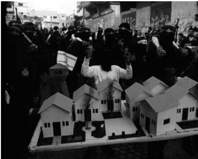
Desfile bat Gazan; parte-hartzaileak maketa bat erretzear dira (Reinhard Krauss, 2001)

rrak jada ez duela zerikusirik espazioa suntsitzearekin, baizik eta hura «berrantolatze»arekin. «Alderantzizko geometria»k, zeinaren helburua baitzen esparru pribatu eta publikoa berrantolatzea eta hiria «barrukoz kanpora» jartzea, orain ere antzera jokatuko luke: «estatu palestinarra» Israelen segurtasun-arazoetan txertatuko luke, eta transgresioz josi, horma deshormatzen saiatzeko.