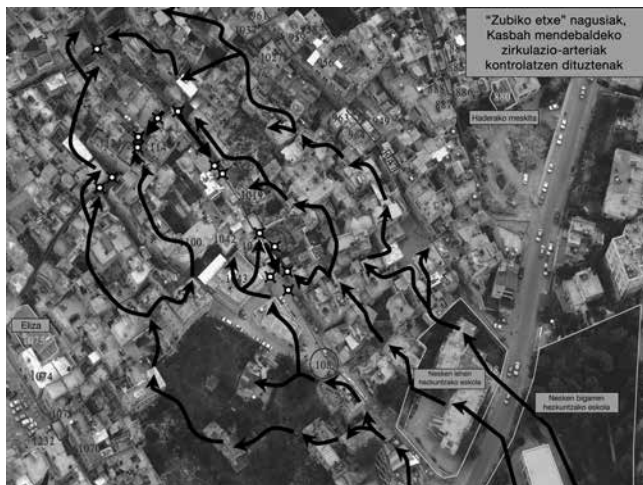
Nablusen aurkako erasoa, 2002ko apirila; izarrek hildako palestinarrak adierazten dituzte (Irudia: OTRI, 2004)

zeharkatzea debekatua dagoen leku bat? Hori interpretazioaren baitakoa besterik ez da. Gure interpretazioaren arabera, debekatuta dago kaleetan zehar ibiltzea, eta debekatuta dago ateetan zehar igarotzea, eta debekatuta dago leihoetan zehar begiratzea, zeren eta arma bat daukagu zain kaleetan, eta lehergailu-tranpa bat daukagu zain ate ostean. Zergatik? Etsaiak modu tradizional eta klasikoan interpretatzen duela-ko espazioa, eta nik ez diot interpretazio horri jaramon egin nahi, ez dut etsaiaren tranpetan erori nahi. Eta ez hori bakarririk: etsaia ustekabeen harrapatu nahi dut. Hori da gerraren funtsa. Irabazi egin behar dut. Ustekabeen agertu behar dut. Eta horretan saiatu ginen.