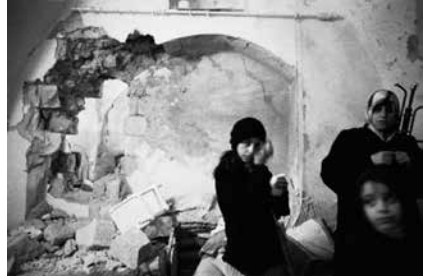
Ezkerrean: Balatako iheslari-esparrua (Israelgo Armadaren argazkia, 2002). Eskuinean: Nablus (Miki Kratsman, 2002)

desberdinek erantzun bat ematen diete ziurgabetasunezko, ustekabeko eta kontrolik gabeko gertaerei, zeinei tirabira baitzeritzen XIX. mendeko filosofo eta militar Carl von Clausewitz-ek. 13