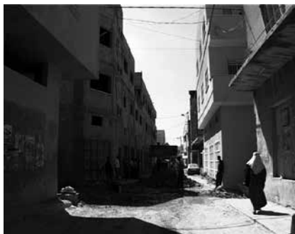
Eraikuntza-lanak Jeningo iheslari-esparruan