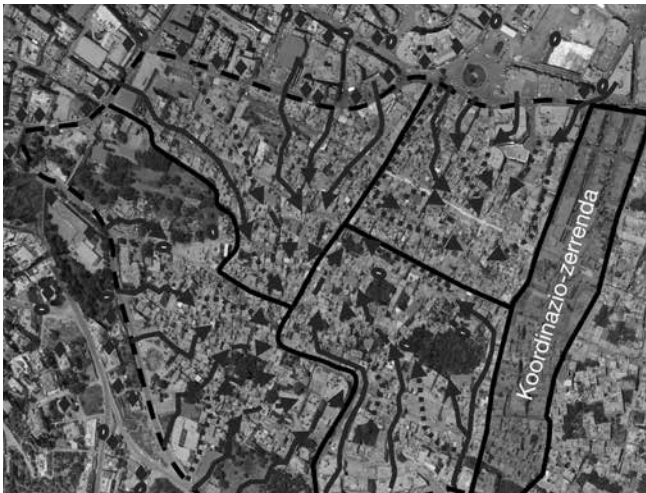
Israelgo Armadak 2002ko apirilean Nablusen aurkako erasoan egin zuen ibilbidea (Irudia: OTRI, 2004)

Hain zuzen ere, armadek beren praktikak eta antolamendu-moldeak egokitzeko egin dituzten saia-kerak aurkari dituzten gerrillen indarkeria-moldeetan oinarritu dira. Egokitu egiten direlako, imitatu egiten dutelako eta elkarrengandik ikasten dutelako, armada eta gerrilla «koeboluzio»-ziklo batean sartzen dira. Gaitasun militarrek beren aurkako erresistentziarekin batera garatzen dira, eta hori bera ere garatu egiten da praktika militarren eraldaketan aurrean. Halere, nahiz eta teknika militarren imitazioak eta berrapropiazioak esperientzia komun bat aditzera ematen duen, israeldarren eta palestinarren eraso-metodoak desberdinak dira funtsean. Erresistentzia palestinar zatikatua erakunde ugariz osatua dago, eta haietako bakoitzak sektore armatu gutxi-asko independente bat du: Ha-